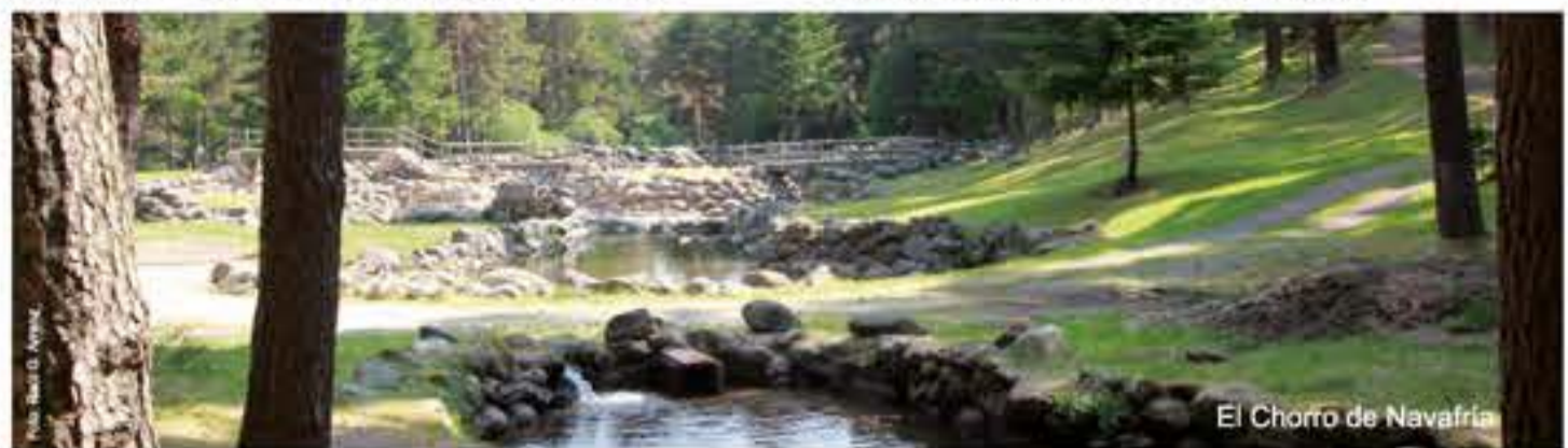
El Chorro de Navafría

Centro de Visitantes Valle de Valsaín - Boca del Asno Ubicada en Ctra CL-601 km 14,3 Valsaín. Teléfono: 921 120 013 https://www.parquenacionalsierraguadarrama.es/es/visita/contacto-cv/cv-valsain