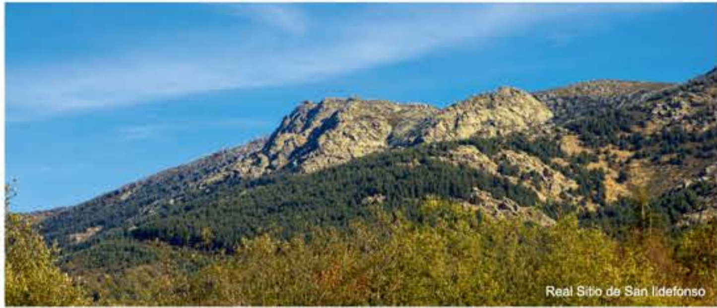
Real Sitio de San Ildefonso

El sustrato geológico está formado por diferentes tipos de rocas de muy diverso origen (plutónicas, metamórficas, sedimentarias y filonianas). Son rocas muy antiguas, del Paleozoico y Mesozoico, siendo las más antiguas los gneises, mármoles y esquistos.