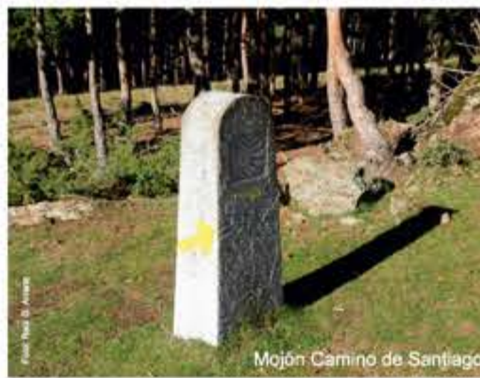
Mojón Camino de Santiago