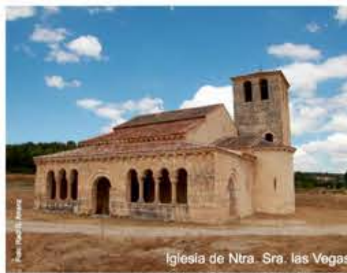
Iglesia de Ntra. Sra. las Vegas

Paseos autoguiados del CENEAM Desde el Centro Nacional de Educación Ambiental existe una red de senderos autoguiados. http://www.magrama.gob.es/es/ceneam/itinerarios/itinerarios-autoguiados/