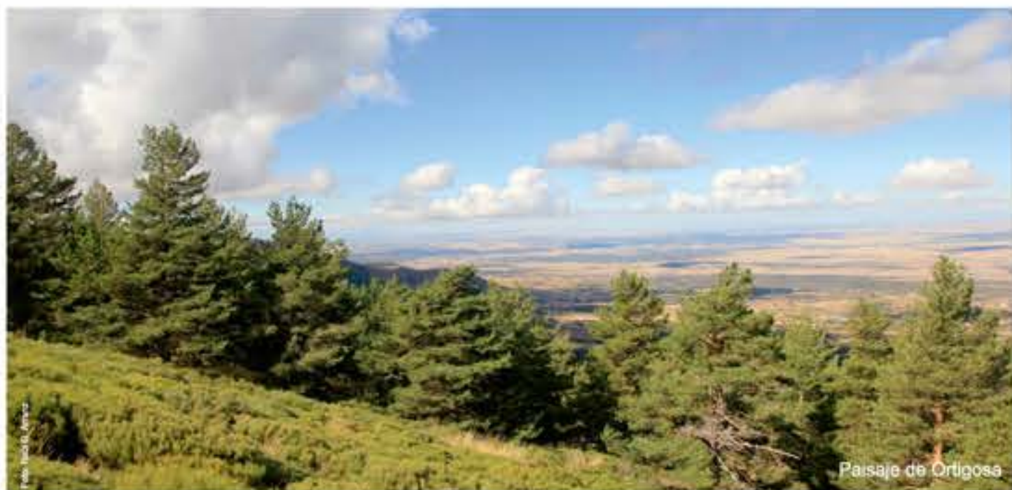
Paisaje de Ortigosa

El Parque Natural Sierra Norte de Guadarrama cierra por el sur la provincia de Segovia y se prolonga en el término municipal de Peguerinos a la provincia de Ávila, formando parte del Sistema Central. Esta gran cordillera se dispone de este a oeste y divide la meseta central de la península ibérica.