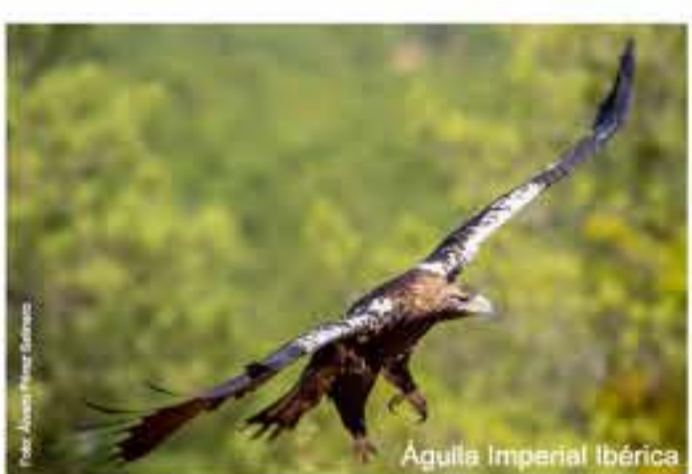
Águila Imperial Ibérica

REPTILES. Se encuentran 23 especies de reptiles, lo que da idea del destacado papel que representa la Sierra de Guadarrama en la conservación de este grupo faunístico. La mayor riqueza de especies aparece significativamente a altitudes intermedias, entre 1.000 y 1.650 m.