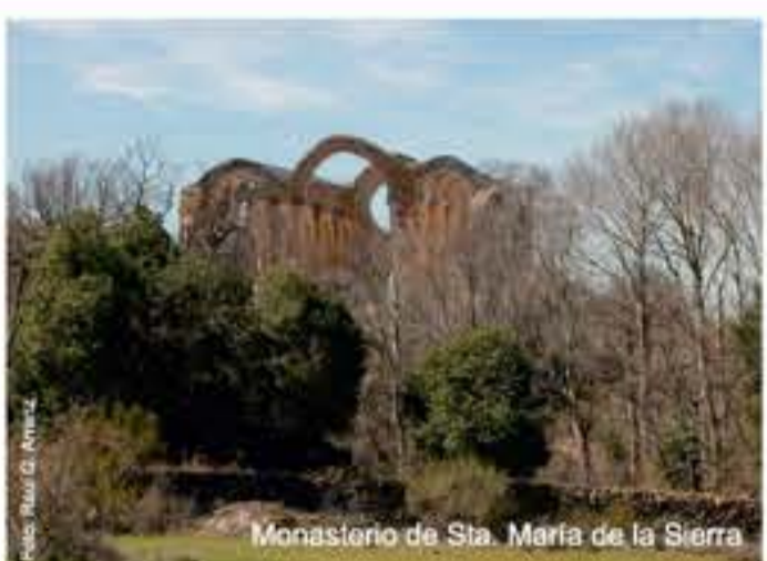
Monasterio de Sta. María de la Sierra