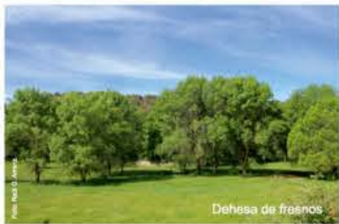
Dehesa de fresnos